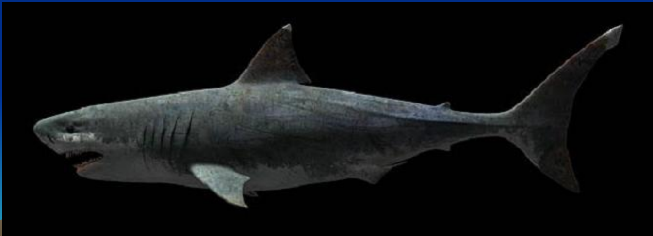
Длина этой рыбы достигла 20 метров.