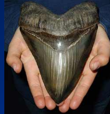
Ископаемый зуб мегалодона