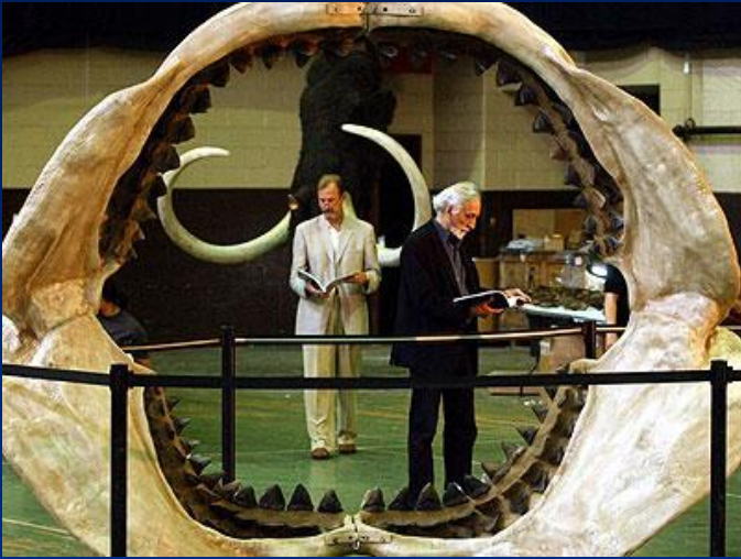
Ископаемые челюсти мегалодона

- морской хищник времен динозавров. Людям известно о его существовании только благодаря нахождению редких ископаемых останков.