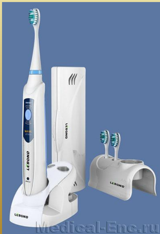
электрическая зубная щётка