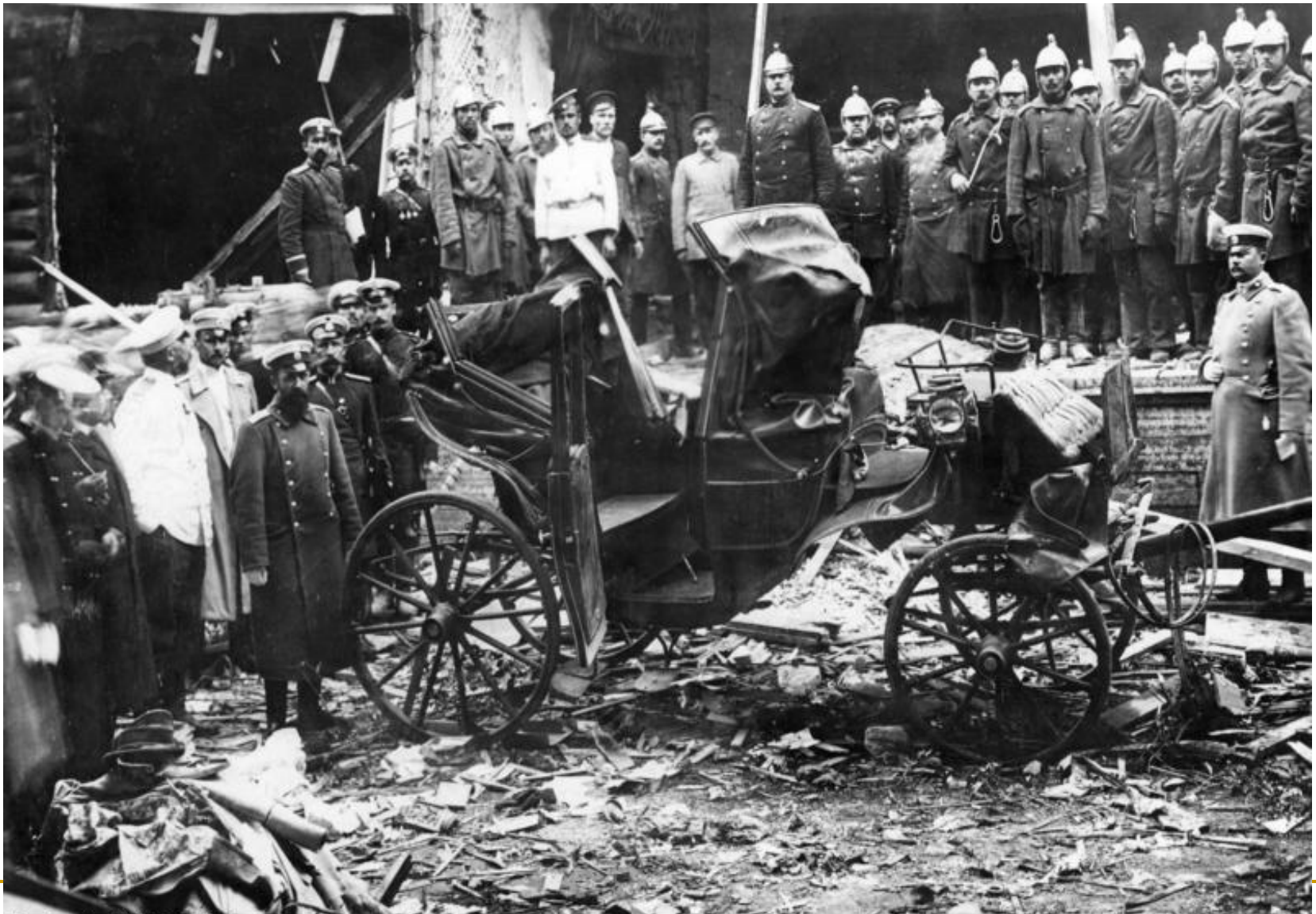
Bild 183-R04510 August 1906