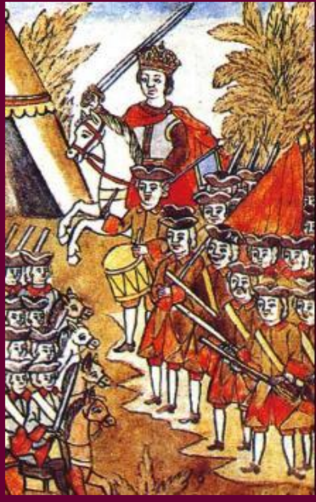
Петр и потешные полки