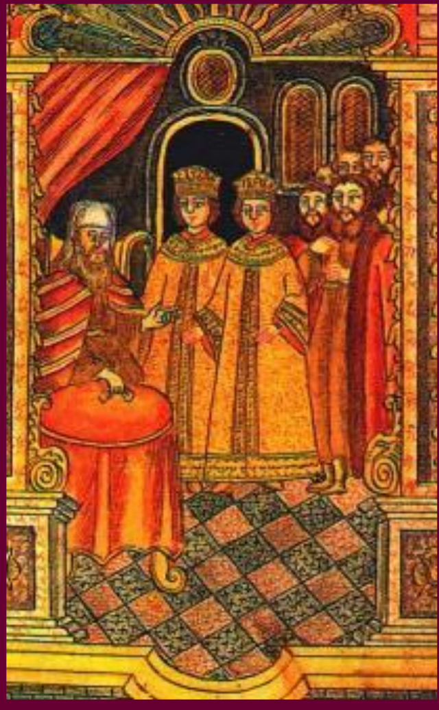
Петр, Иван и патриарх Андриан. Миниатюра к. 17 в.

Во время восстания, стрельцы потребовали сделать царями Петра и Ивана, а Софью регентом.