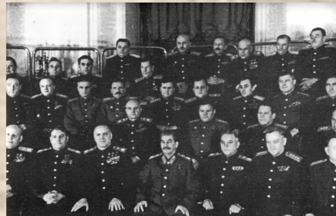
Соображения по плану стратегического развертывания сил Советского Союза на случай войны с Германией