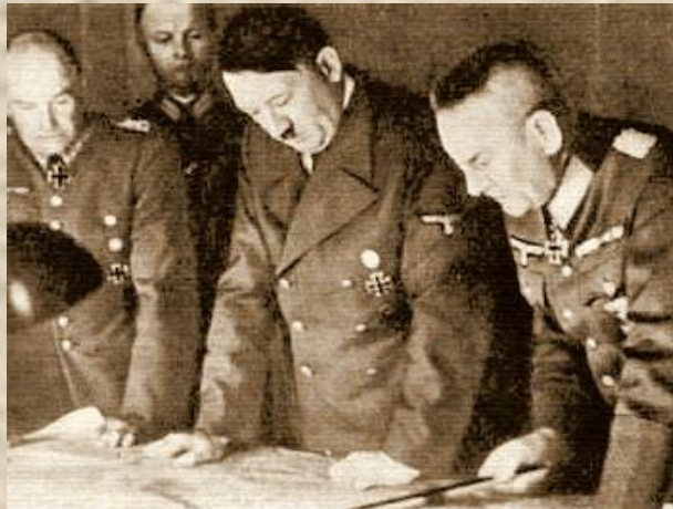
Директива № 21 План «Барбаросса»