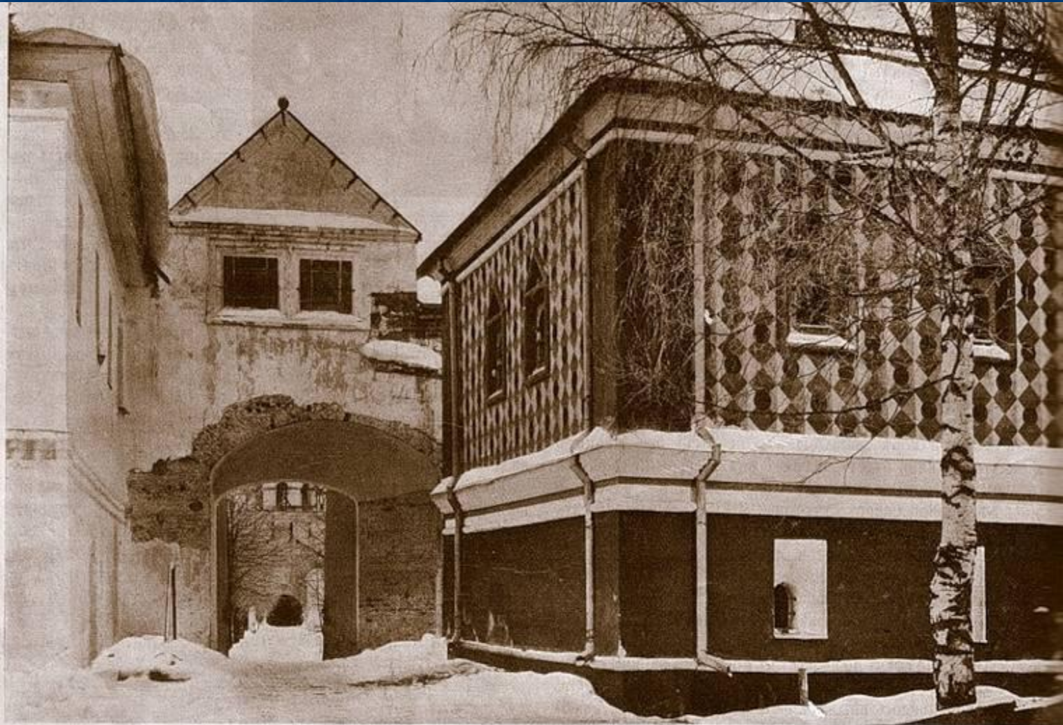
Городъ Кострома. Святыя Ворота у Палать царя Михаила Ѳеодоровича. Отсюда провожали перваго царя на царствованіе въ Москву.