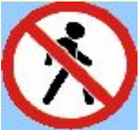
Движение пешеходов запрещено!