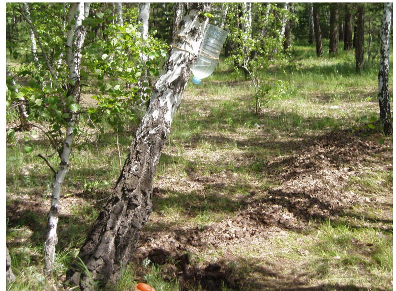
Туристские самоделки (умывальник) МОУ «ЧСОШ №1»