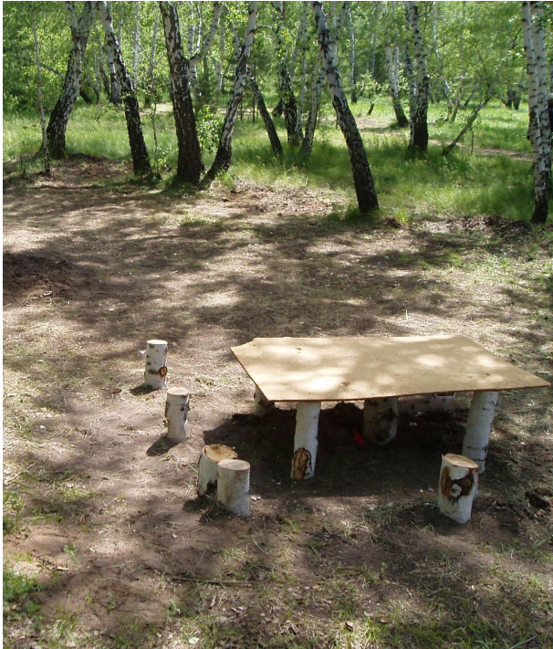
Обеденная зона команды МОУ «ЧСОШ №1»