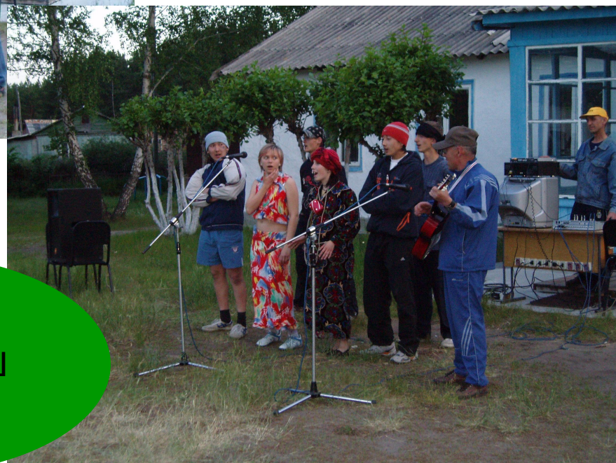
Команда МОУ «ЧСОШ №1»