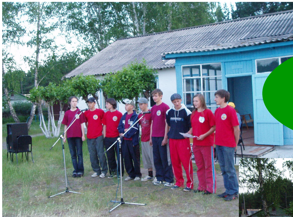
Команда МОУ «Иртышская СОШ»