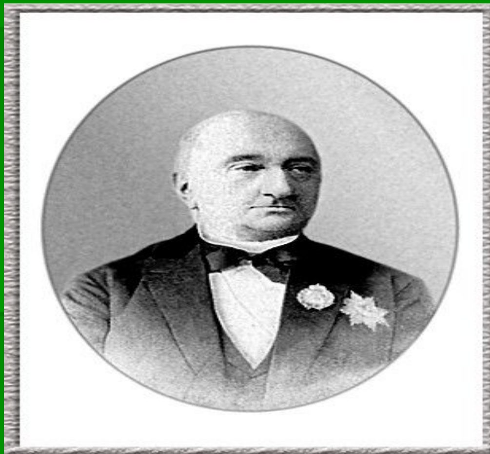
Иван Давыдович Делянов – министр народного просвещения