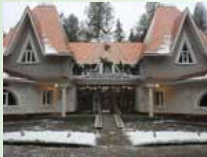
Филиал Московского зоопарка