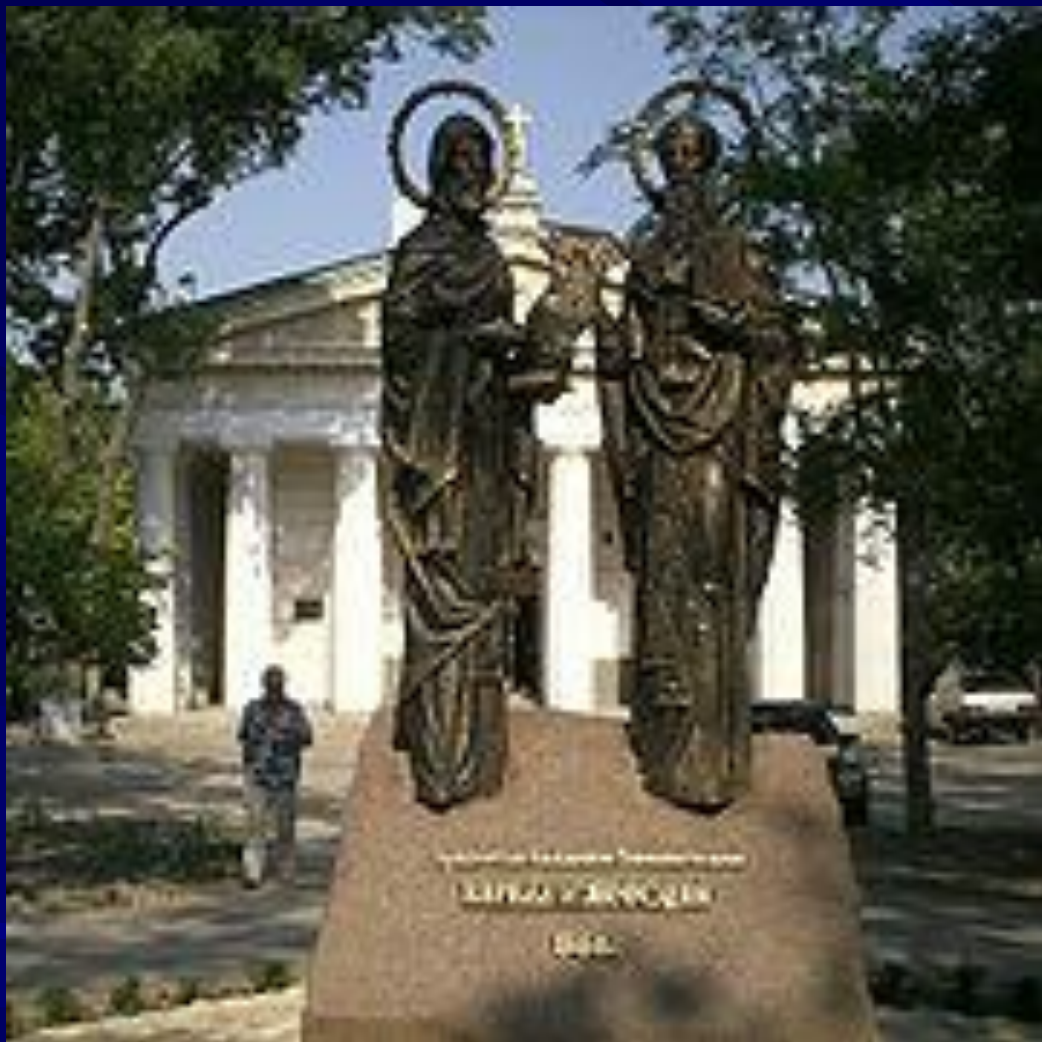
Памятник Кириллу и Мефодию в Севастополе

До пострижения в монахи братьев звали Константин и Михаил. Они были очень образованными людьми. Святые Кирилл и Мефодий своей проповедью много способствовали утверждению христианства в Болгарии, где находились примерно с 850 года. Из Болгарии христианская вера распространилась в соседнюю с ней Сербию.