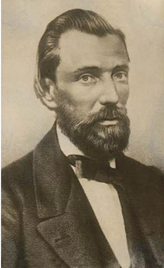
Иван Саввич Никитин (1824–1861). Фото XIX в.

Под большим шатром Голубых небес Вижу даль степей Зеленеется;