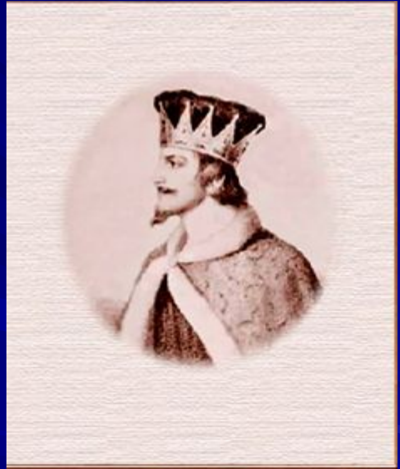
Святополк I Окаянный.