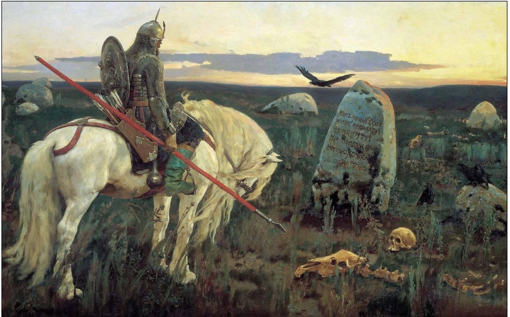
«Витязь на распутье» (1882, ГРМ)