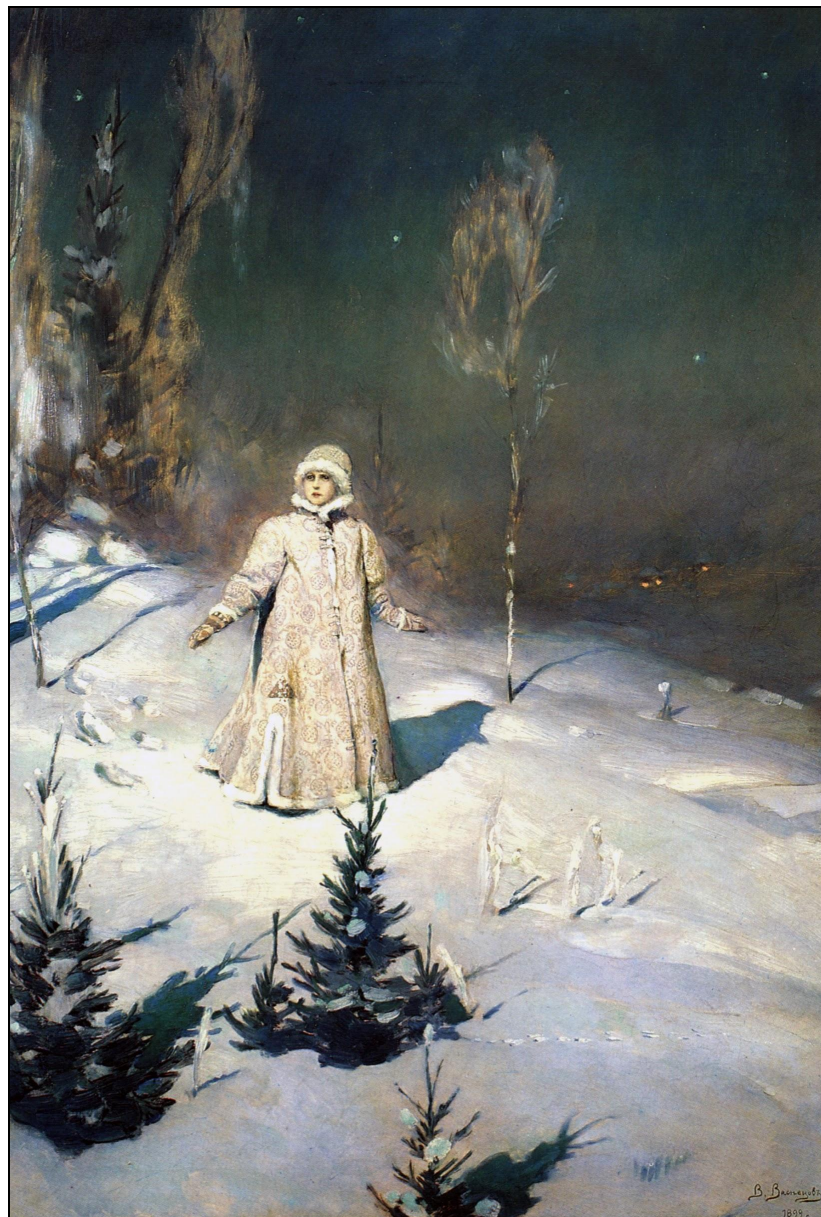
«Снегурочка» (1899, ГТГ)