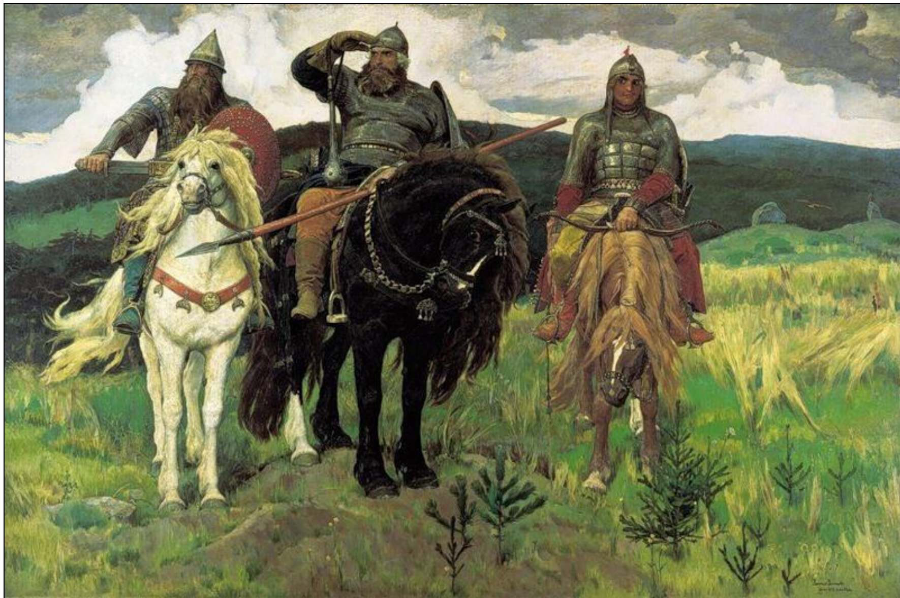
«Богатыри» (1898, ГТГ)