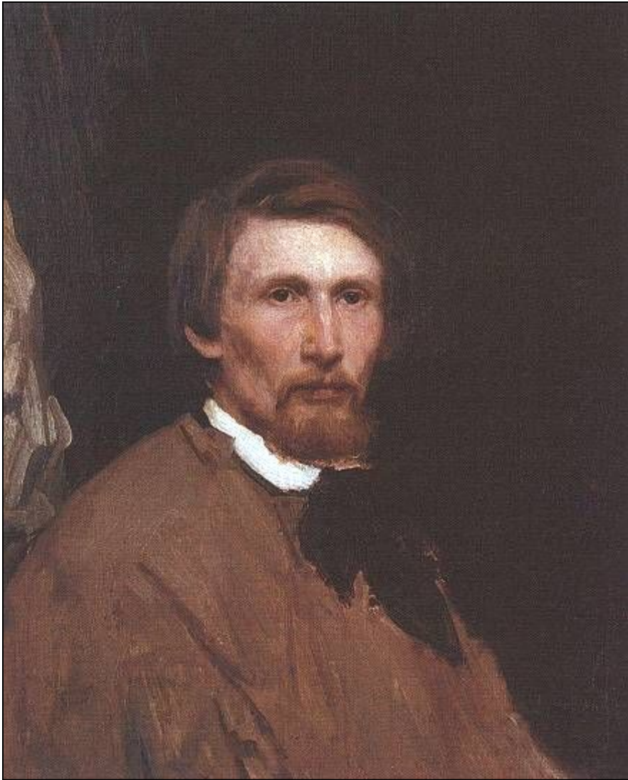
Автопортрет (1873, ГТГ)