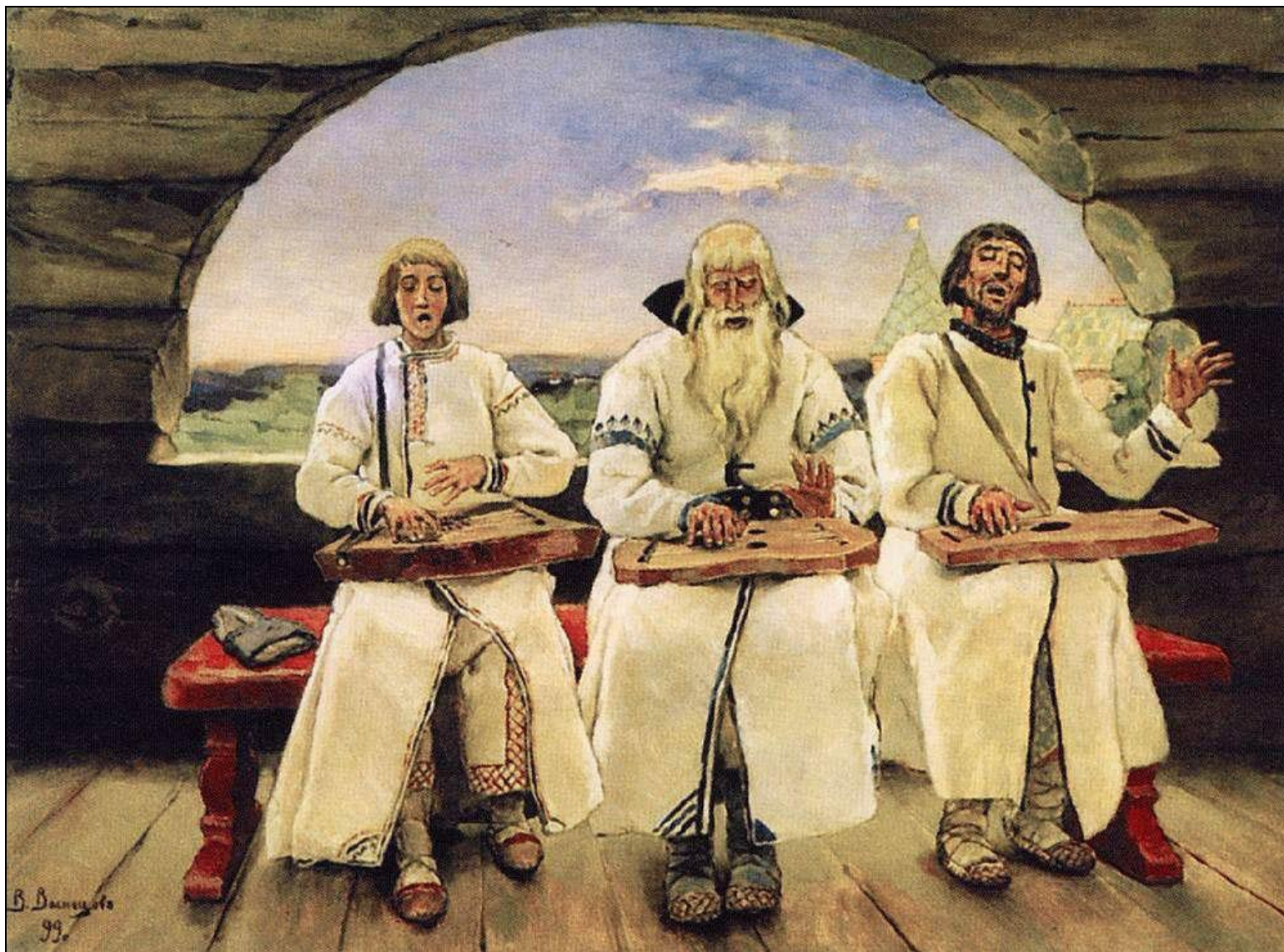
«Гусляры» (1899, Пермская государственная художественная галерея)