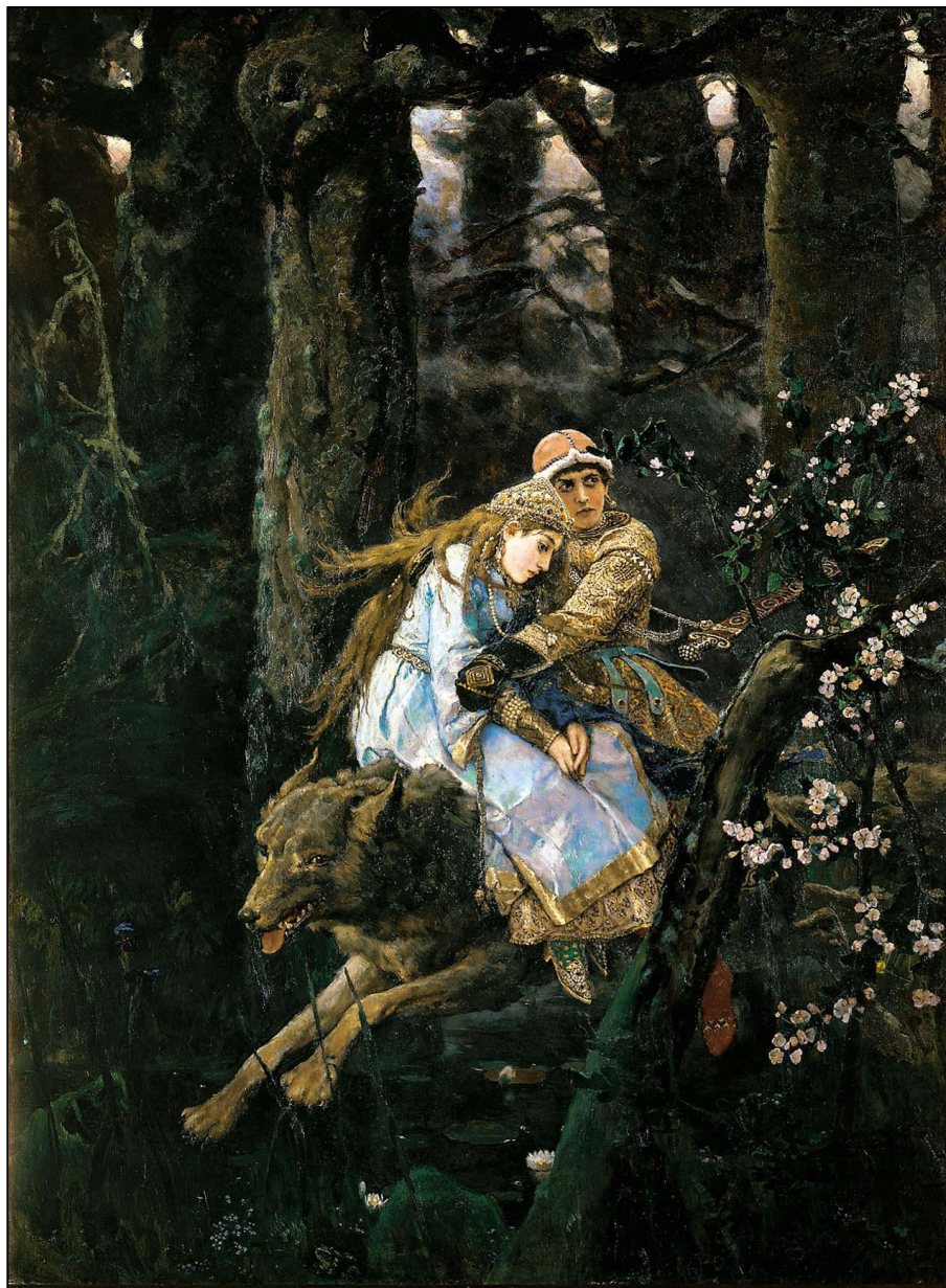
«Иван-царевич и Серый волк» (1889, ГТГ)