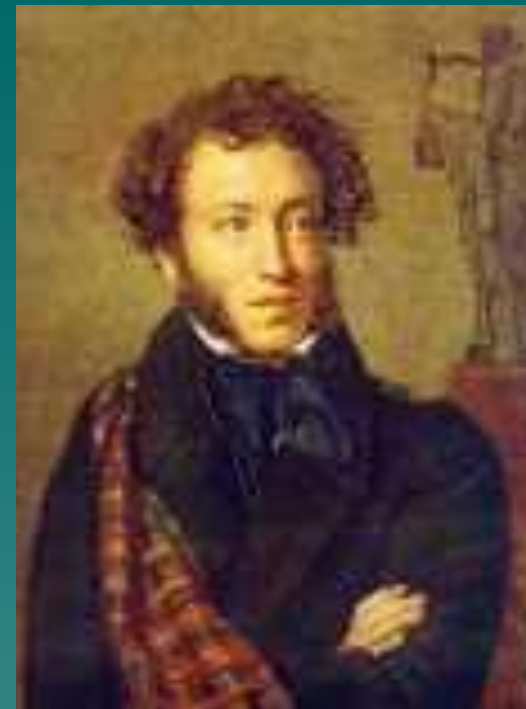
А. С. ПУШКИН