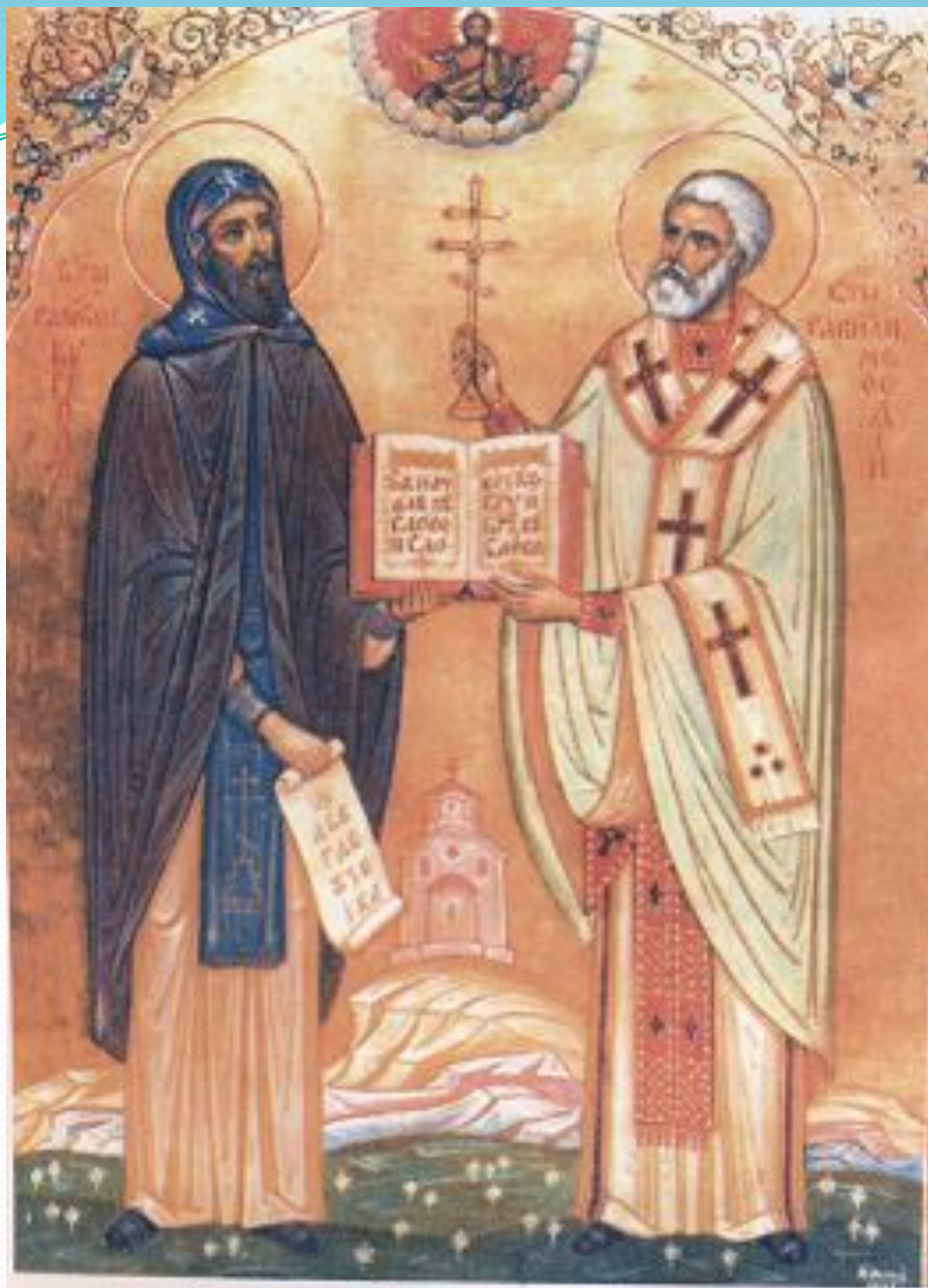
Святые Кирилл и Мефодий. Икона. 1969 г.

Если же спросить славянских грамотеев так: Кто вам письма сотворил или книги перевел, То все знают и, отвечая, говорят: Святой Константин Философ, нареченный Кириллом, — Он нам письма сотворил и книги перевел.