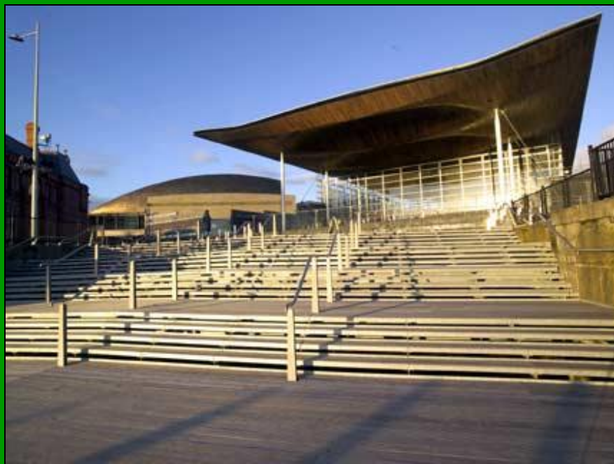
Здание Национальной Ассамблеи в Кардиффе - Senedd