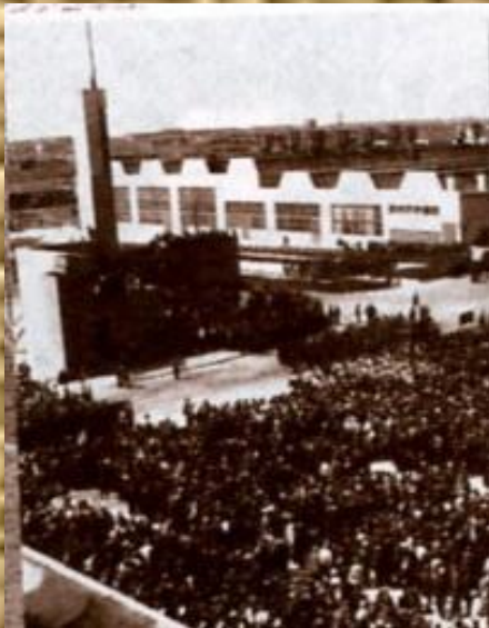
Митинг, посвященный пуску ЧТЗ. 1 июня 1933г.

1 июня 1933 года с конвейера завода сошли первые 13 тракторов.