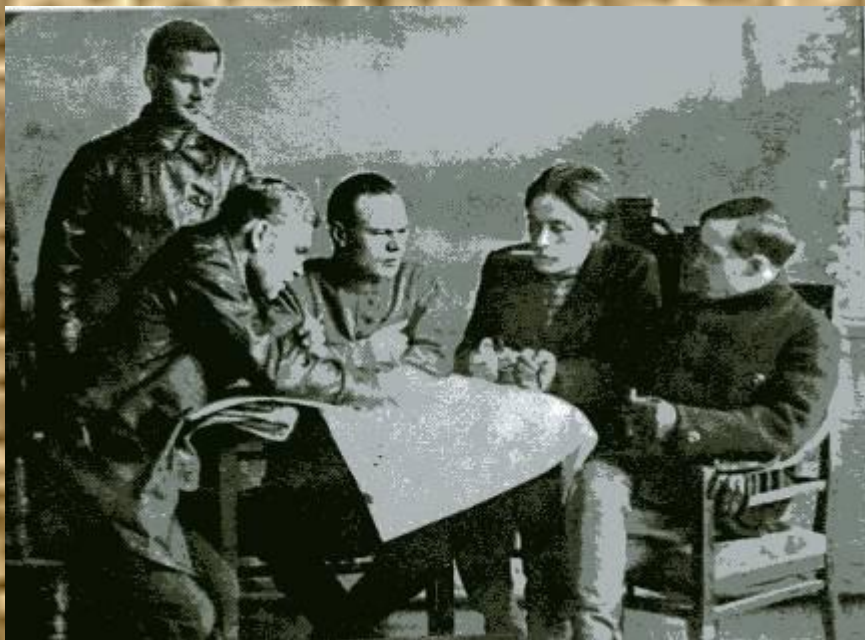
Продпятерка в Челябинске, 1921г.

Осенью 1922г. Стали ощущаться первые результаты изменения аграрной политики большевиков. К 1925 г. сельское хозяйство приблизилось к довоенному уровню производства.