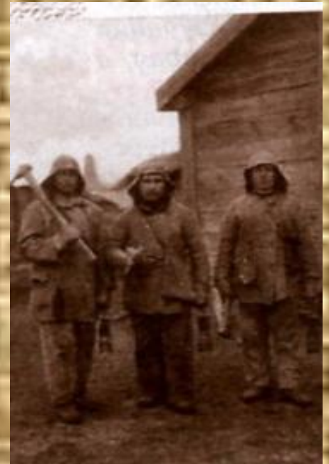
Шахтеры Челябинских копей.

Одним за другим сооружались электрометаллургический комбинат- производитель первых советских ферросплавов ( июль 1931г. ), электролитный цинковый и др.