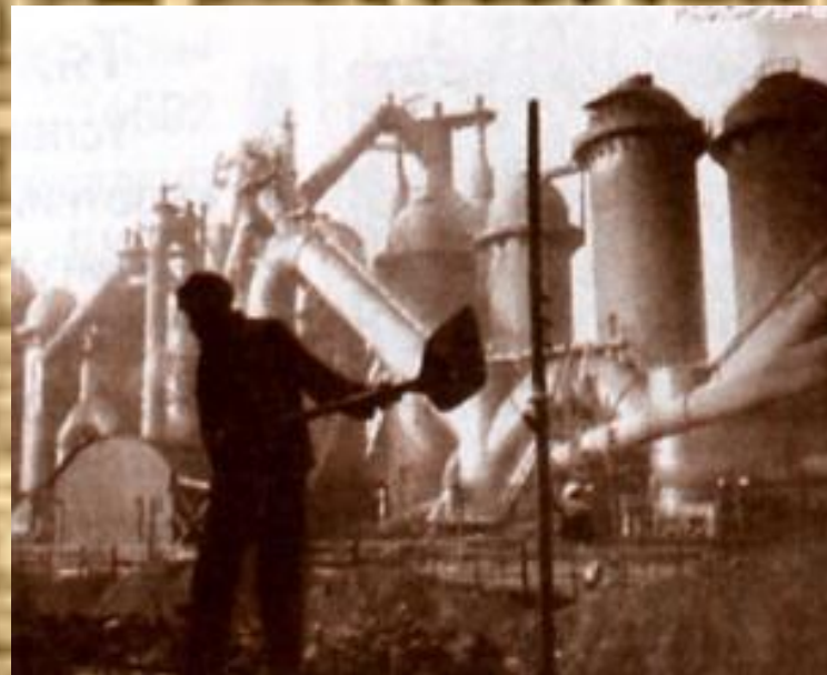
Магнитогорский металлургический комбинат. 1930 –е гг.

Делегаты международного геологического конгресса, посетившие ММК в 1937 году , назвали предприятие « русским чудом ».