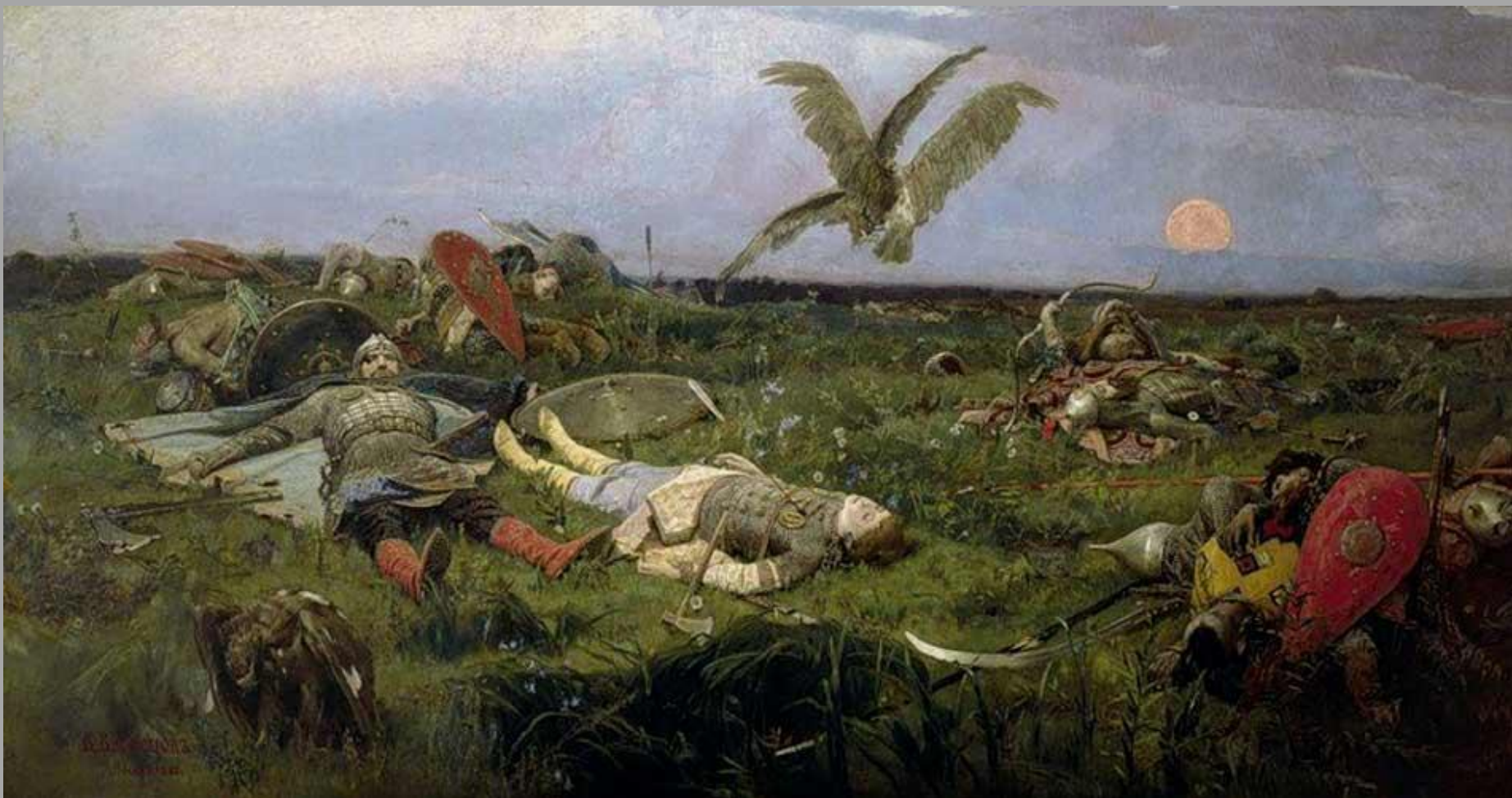
5.2. В.М.Васнецов «После побоища Игоря Святославовича с половцами» 1880г.,х.,м, Государственная Третьяковская галерея