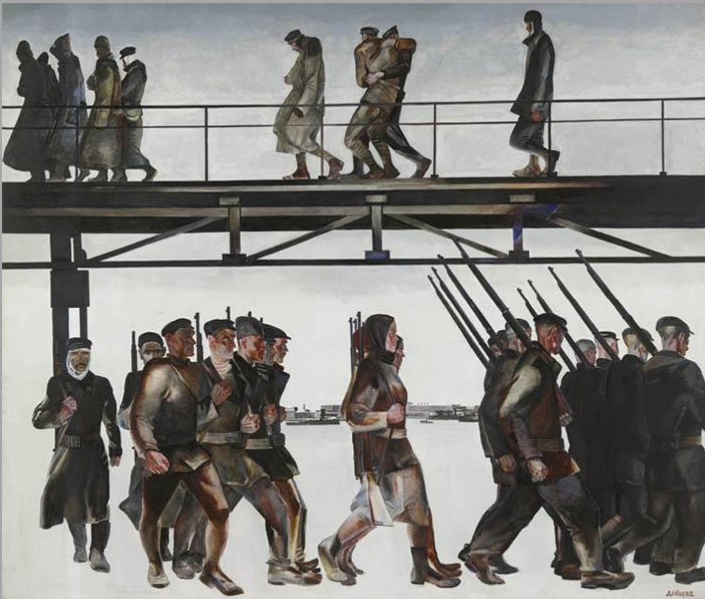
5.5. А.Н.Дейнека «Оборона Петрограда» 1928г., х.м., Центральный музей Вооруженных Сил России, Москва