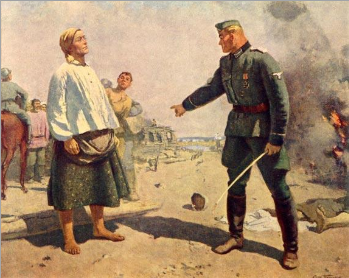
5.6. С.М.Герасимов «Мать партизана» 1942г., х.м., Государственная Третьяковская галерея