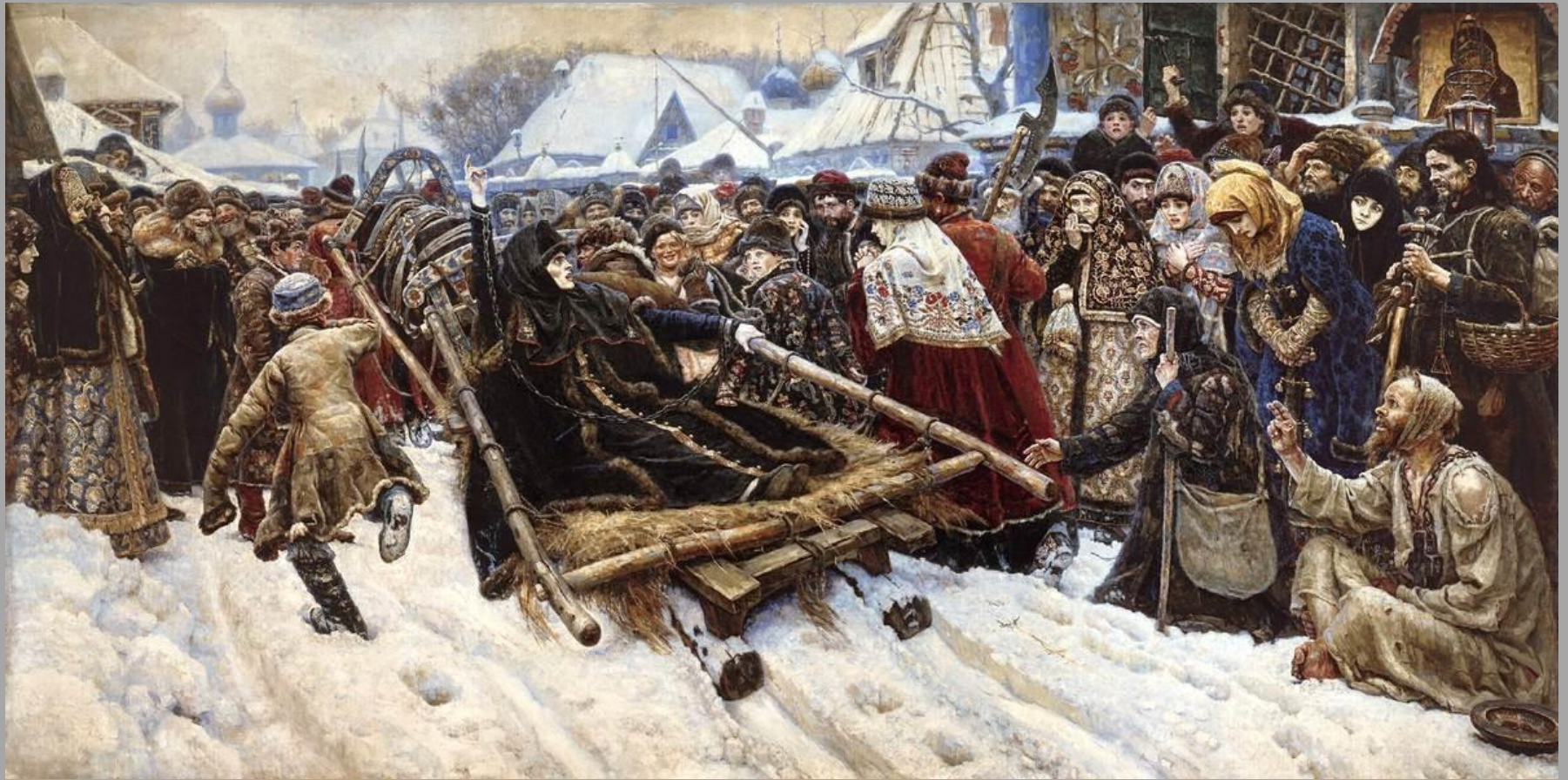
5.3. В.И.Суриков «Боярыня Морозова» 1887г.,х.,м., Государственная Третьяковская галерея