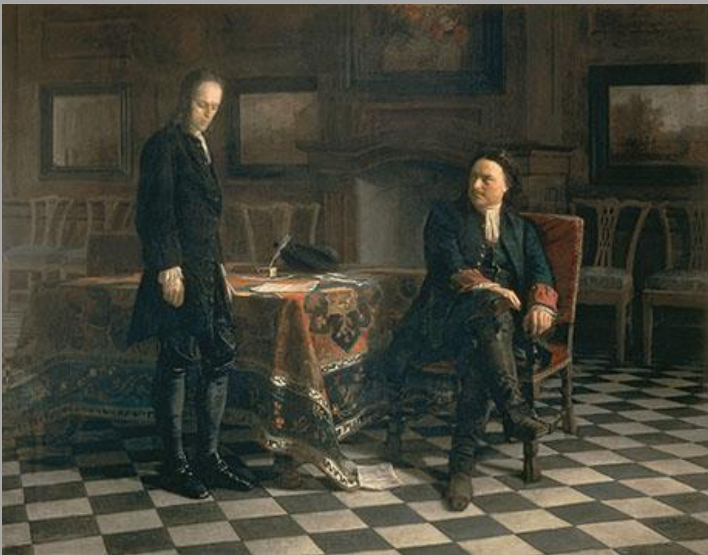
5.4. Н.Н.Ге «Пётри допрашивает царевича Алексея в Петергофе» 1871г., х.м., Государственный Русский музей