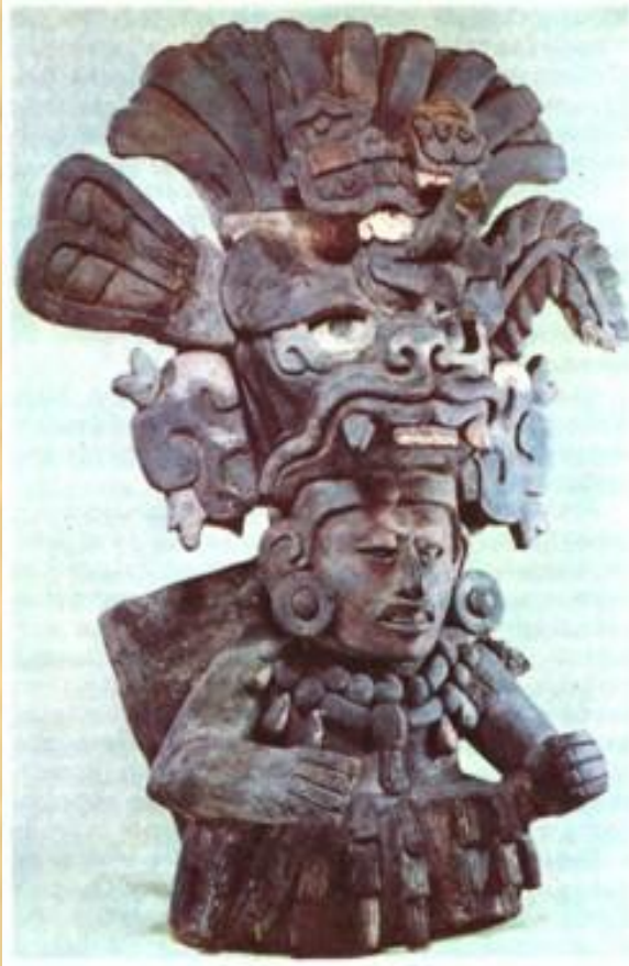
Ритуальная урна (деталь).