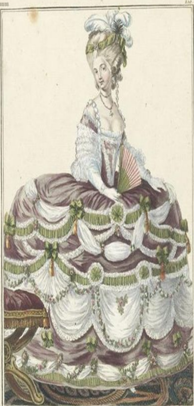
Duchesse occupant une des premières places chez la Reine. Elle est vêtue d'un habit de Couleur de la Grande poudre le devant de la jupe est garni de Gaze de Blanche et de Fleurs de Heures attachées par inter- valles avec des manes de Rubans d'un pendent des Glaces.

A Paris chez les Comtesse et Marquis à la Ville de Commerce rue d'Anjou. A. P. D. R.