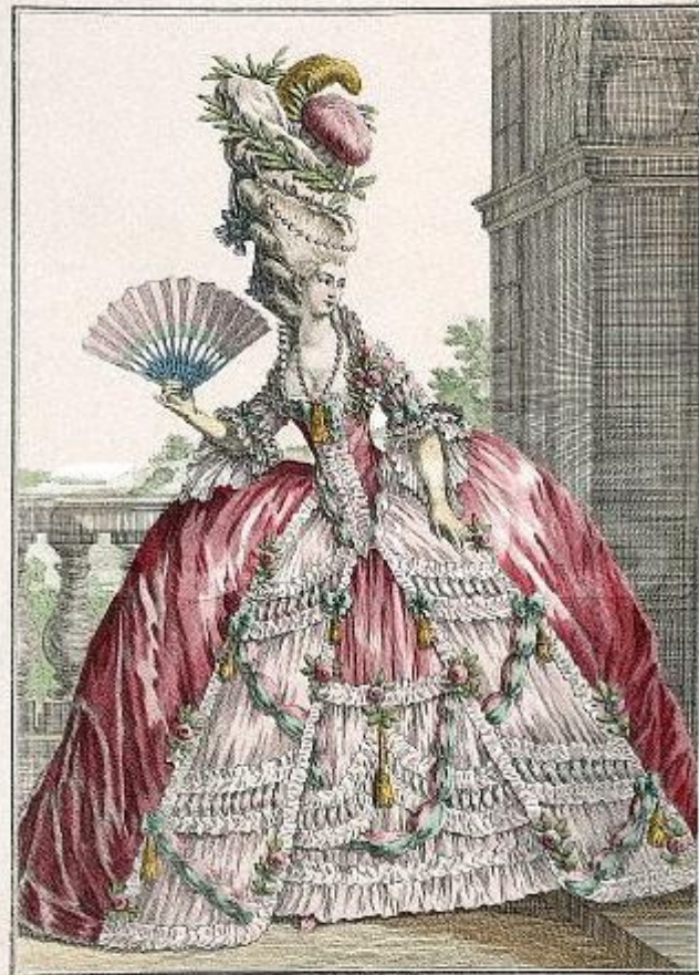
Jeune Dame de Qualité en grande Robe coiffée avec un Bonnet ou Poul elegant dit la Montagne.

A Paris chez les Comtesse et Marquis à la Ville de Commerce rue d'Anjou. A. P. D. R.