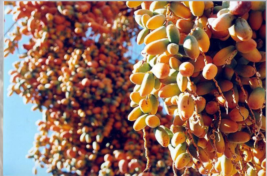
Плоды финиковой пальмы

Основные потребности в продовольствии удовлетворяются за счет импорта.