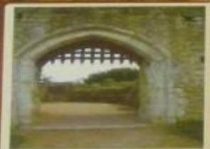
Ворота с решеткой