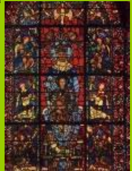
Витраж собора в Шартре