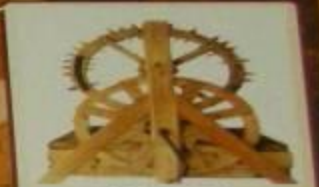
Колодец с механизмом