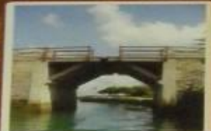
Подъемный мост через ров с водой