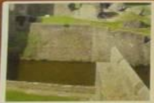
Ров с водой