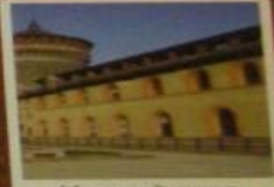
Нижний двор с хозяйственными постройками