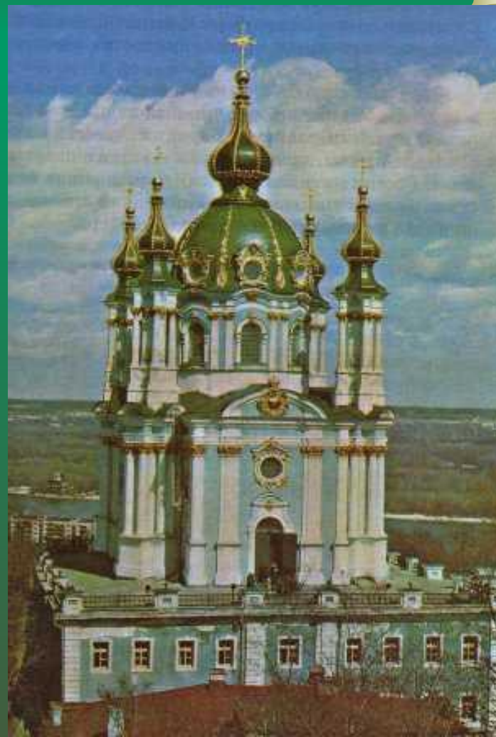
Архитектурные творения Растрелли