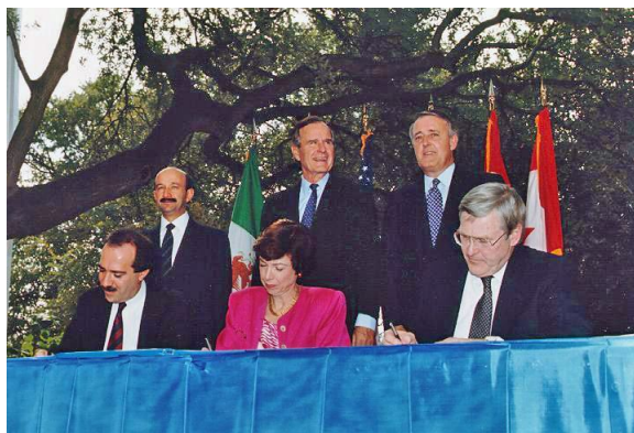
Подписание НАФТА в 1992 г.

Запасы нефти, газа, урана, цинка, золота, никеля и др.