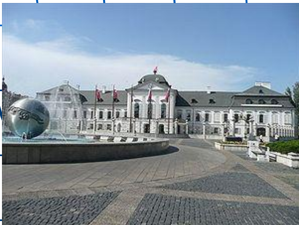
Грасалковичів з канцелярією президента