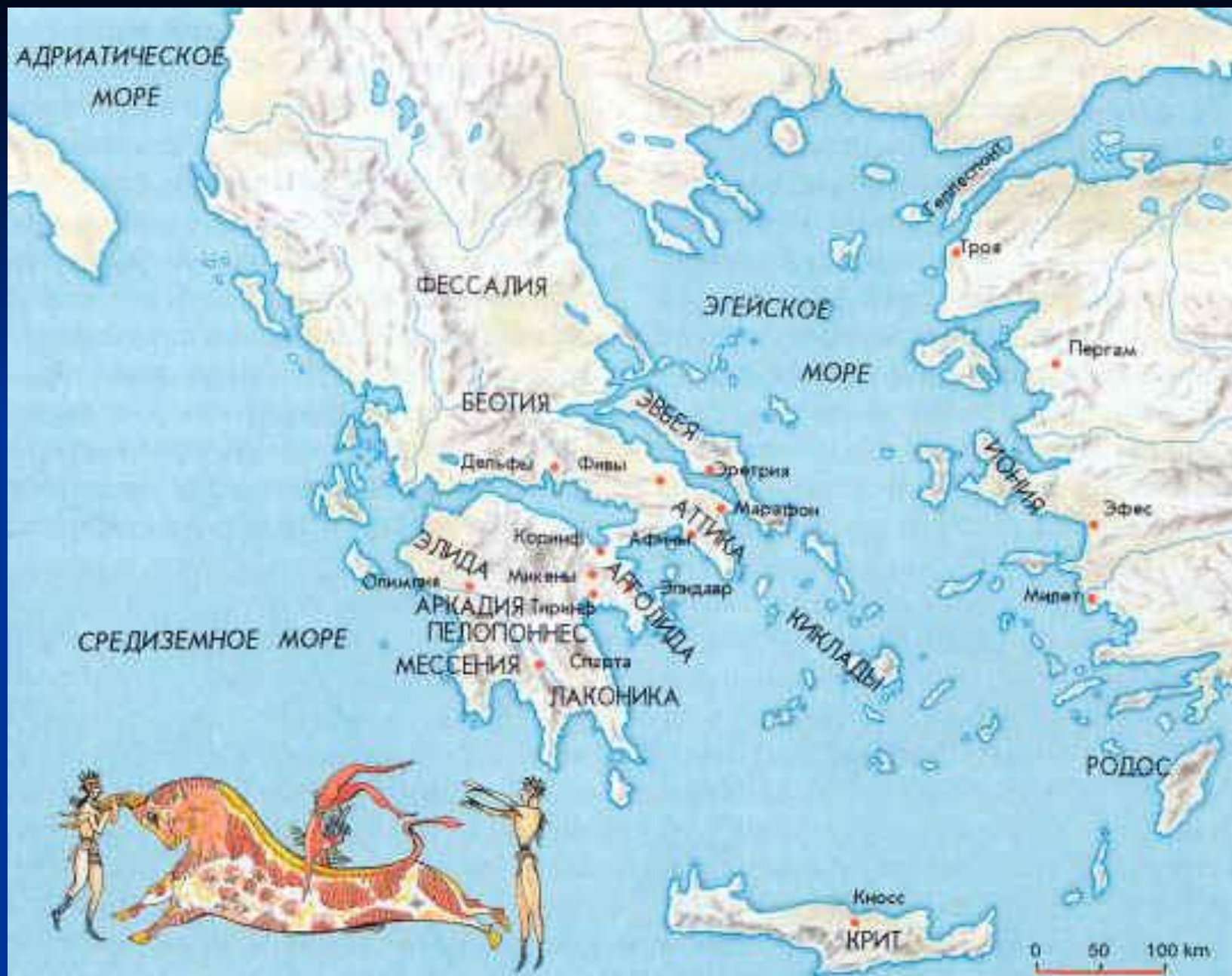
Греция VIII-VI вв.