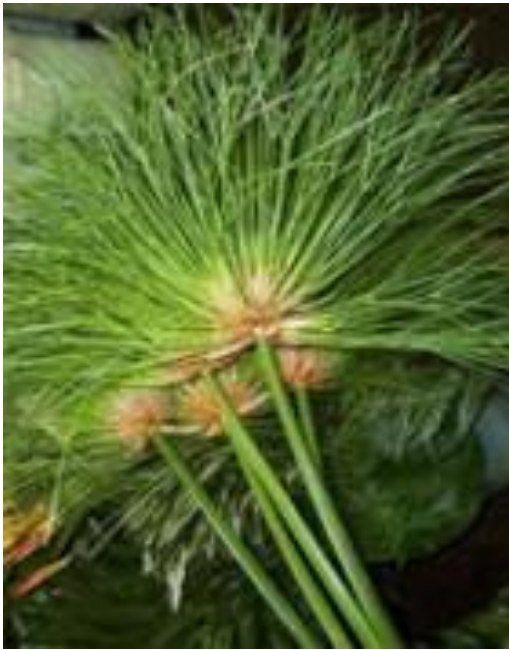
Стебли папируса Папирус – водный травяной цветок