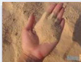
песок и глина

К ним относят породы, содержащие собственно обломки пород и минералов и продукты их механического (физического) преобразования — окатанные зерна пород и минералов.