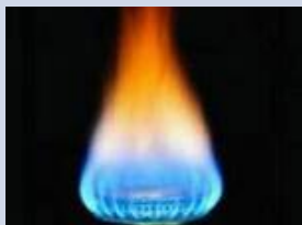
нефть и газ