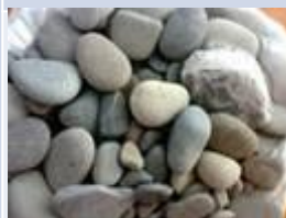
гравий, галька, валуны