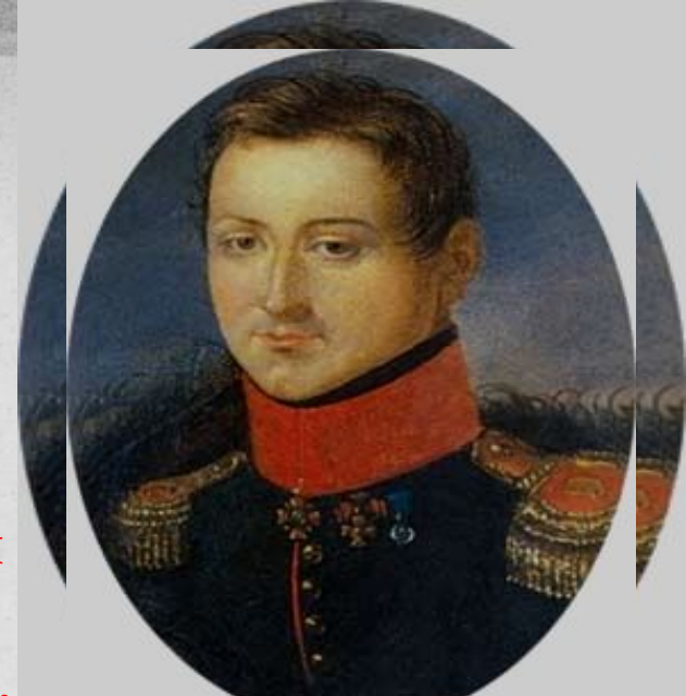
С.Муравьев - Апостол

Пять декабристов: П. И. Пестель, С. И. Муравьев-Апостол, М.П. Бестужев-Рюмин, К. Ф. Рылев, П. Г. Каховский приговорены к смертной казни четвертованием, замененной повешением.