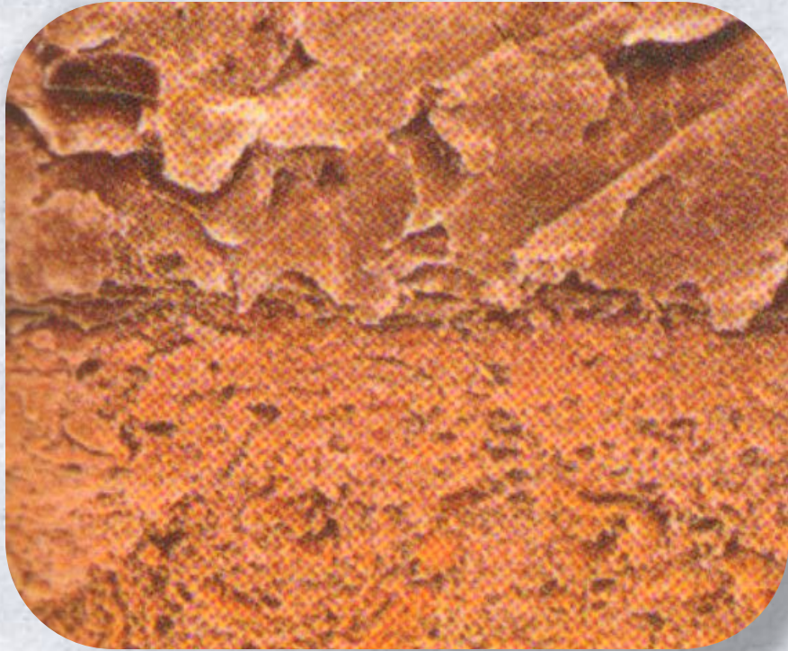
Роговой слой кожи под микроскопом.

Эпидермис состоит из нескольких пластов. Верхний пласт представляет собой скопление ороговевших мёртвых клеток. При мытье они отшелушиваются. В нижних слоях эпидермиса образуются новые клетки, которые заменяют исчезнувшие клетки.