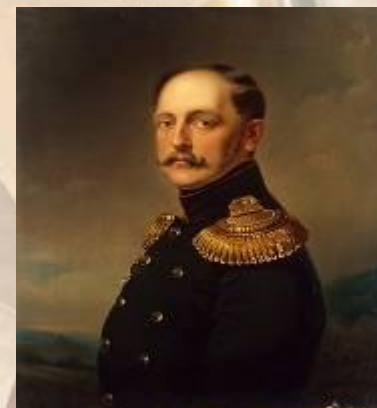
Николай I (1825 - 1855)