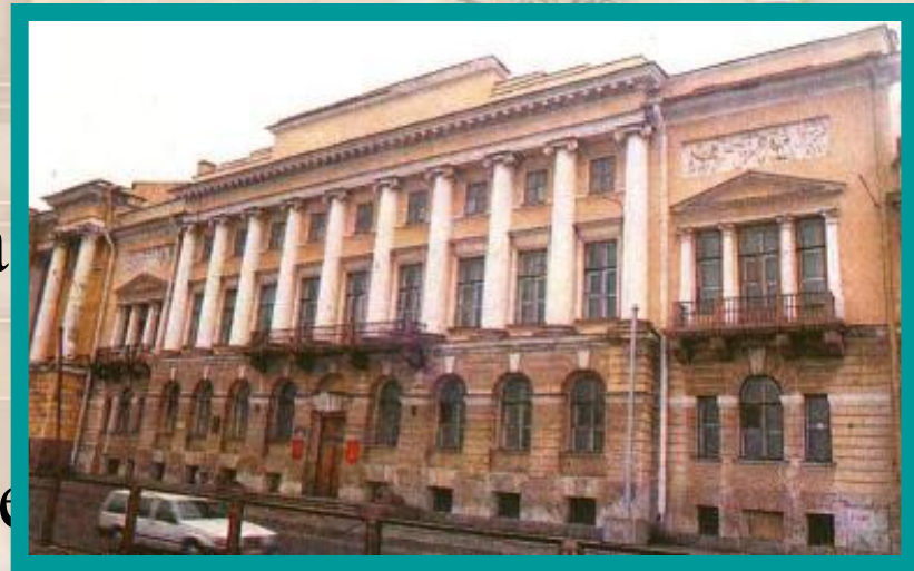
Дом в котором прошло последнее собрание декабристов