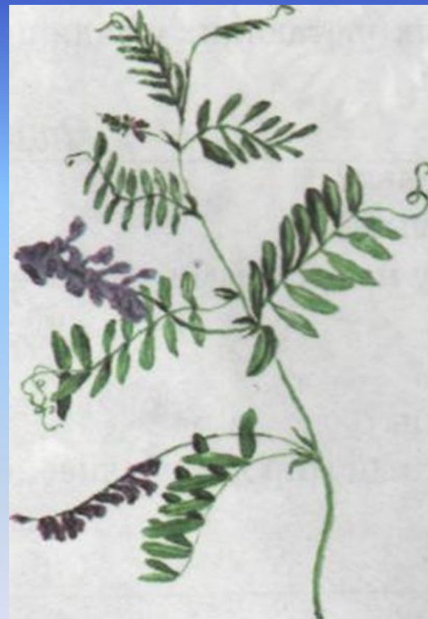
Семена вики (мышинного гороха)