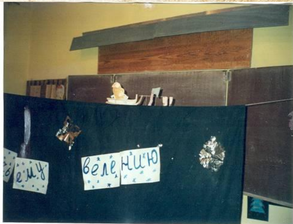
Спектакль «По щучьему велению»