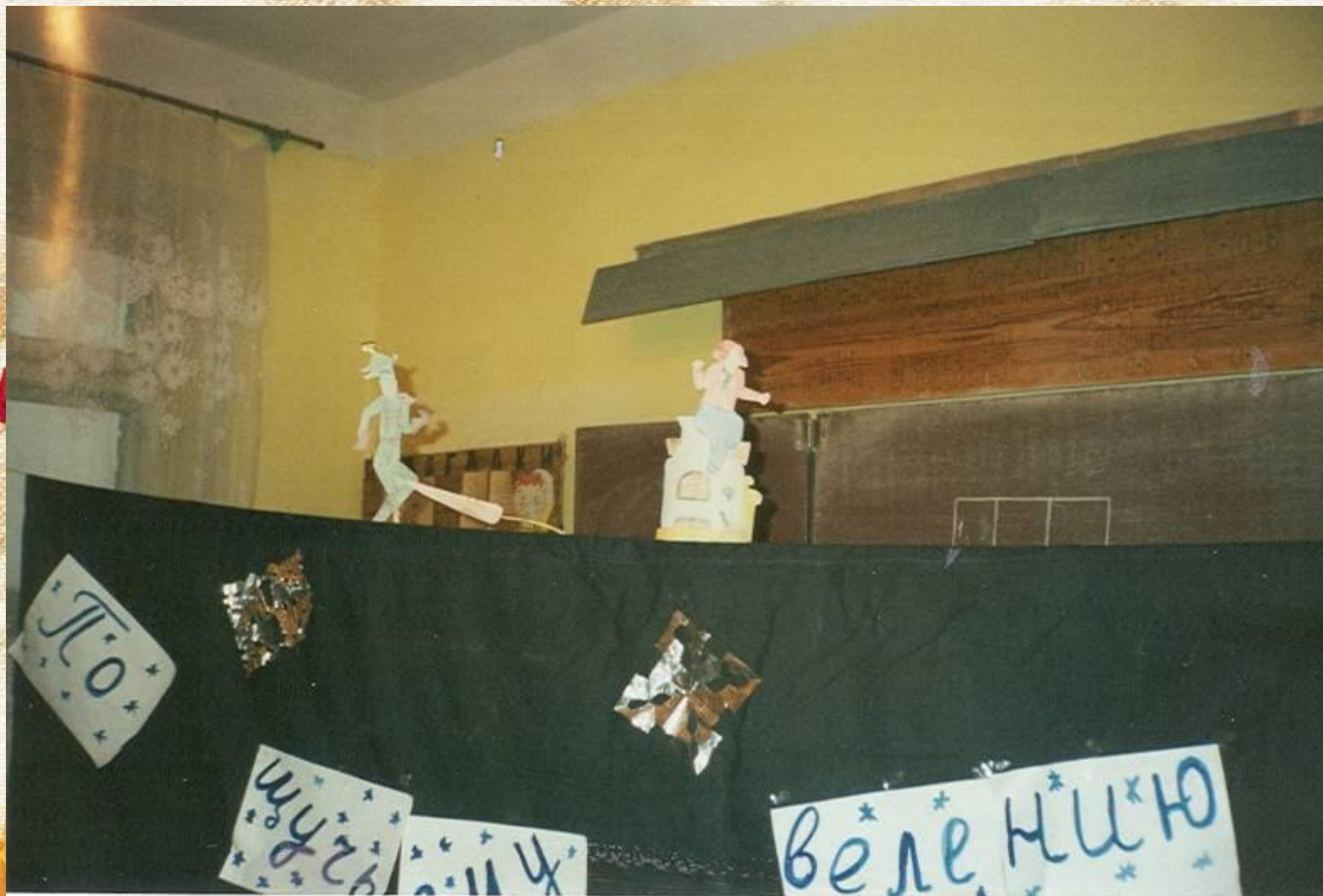
Кукольный спектакль «По щучьему велению»