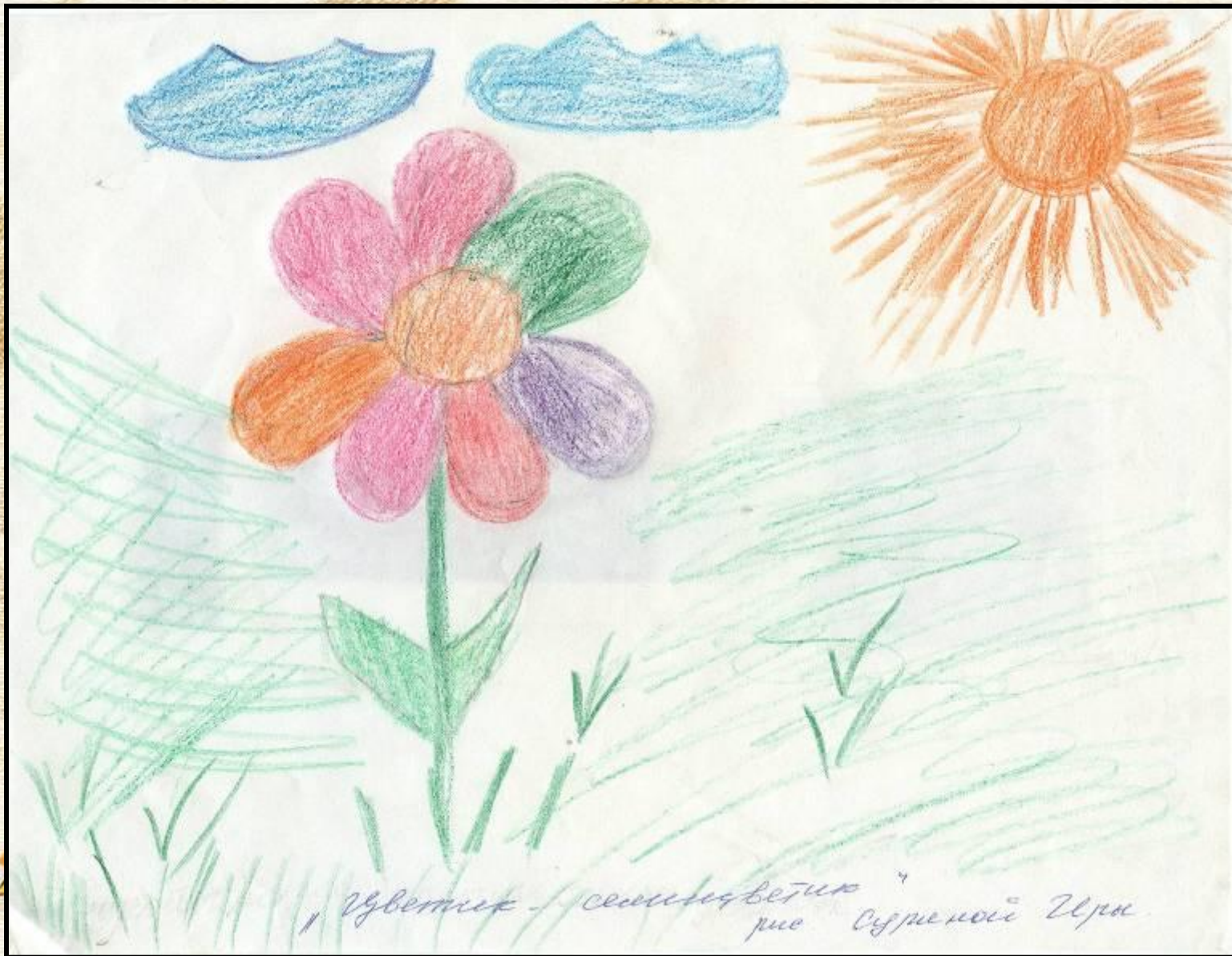
«Цветик - семицветик»