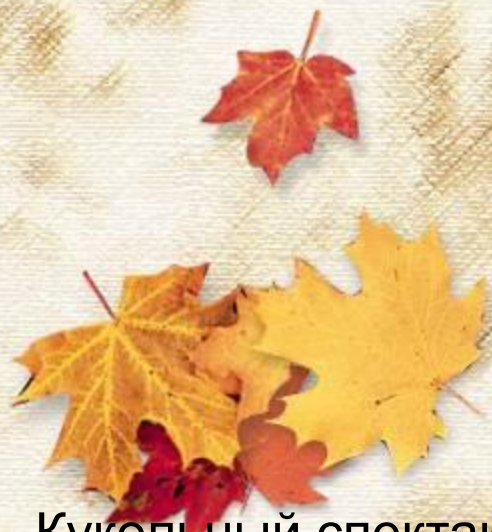
Кукольный спектакль «Теремок»