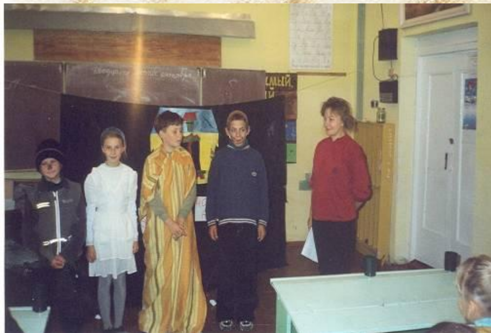
Ребята в костюмах героев русских народных сказок