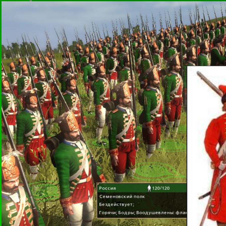
Россия 120/120 Семеновский полк Бездействует; Горячи; Бодры; Воодушевлены: фла

Что представляла собой русская армия XVIII века?