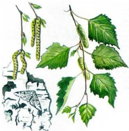
Береза - 24%