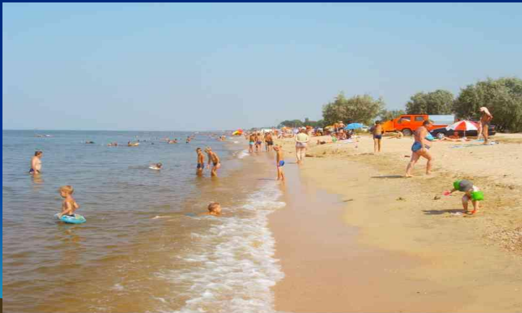
(фото 5 Побережье)