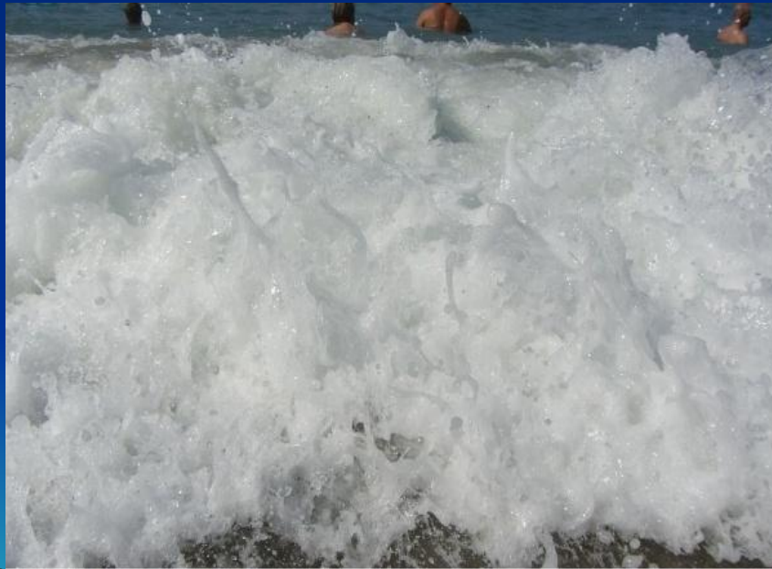
(фото 8 «Побережье Алании»)