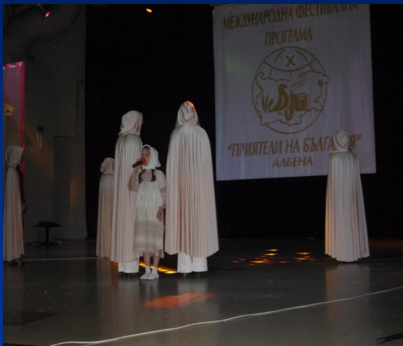
Фото 3 (выступление (я – самая маленькая с микрофоном)