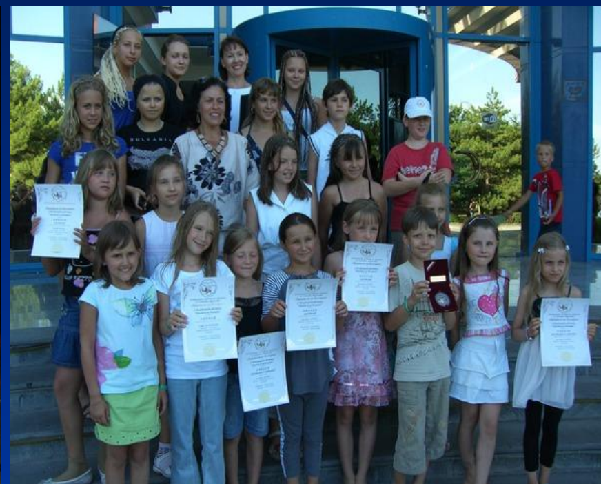
фото 4 (я в первом ряду вторая справа)