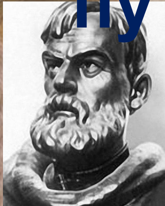
Семен Иванович Дежнев