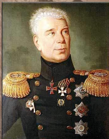
Иван Федорович Крузенштерн