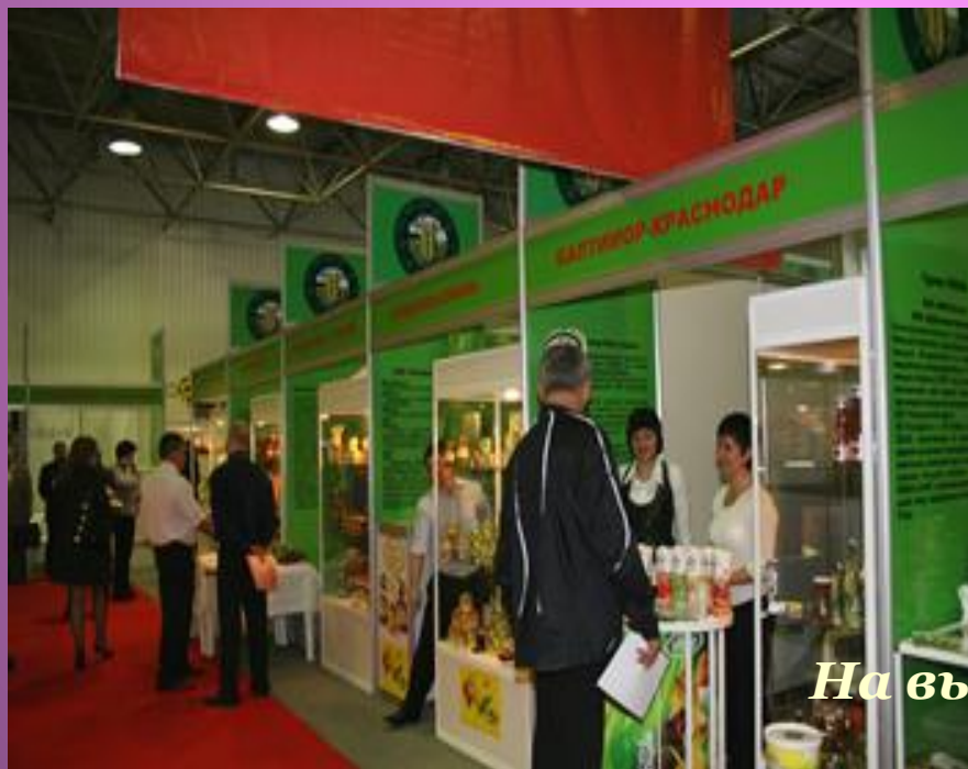
На выставке кубанских товаров

«Я, конечно, не знаю, буду ли я жить завтра, но если я завтра проснусь, то уверен, что прежде всего выпью чая».