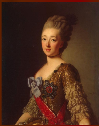
Августа-Вильгельмина- Луиза Гессен-Дармштадтская (Наталья Алексеевна) (1755-1776)