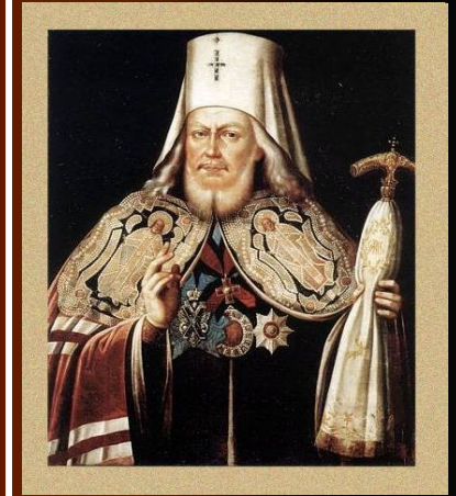
Митрополит Московский Платон (Левшин) (1737-1812)