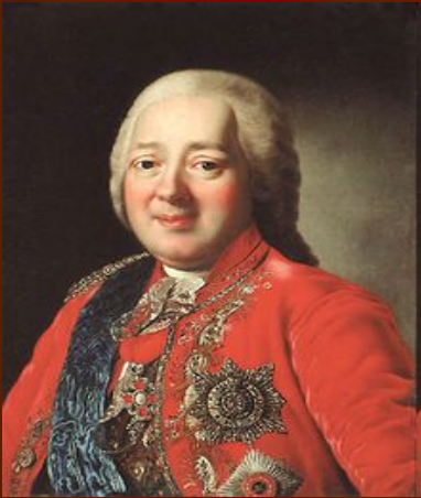
Граф Н.И.Панин (1718-1783)