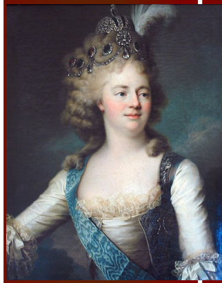
София Доротея Вюртембергская (Мария Фёдоровна) (1759-1828)