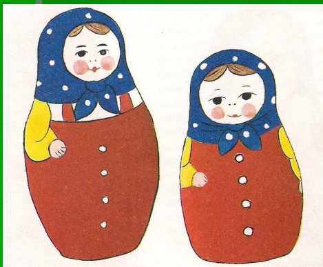
Фабрика №1, 1960г. Массовый выпуск