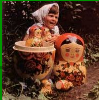
НИИ игрушки. 1958г. Матрёшка-неваляшка со звуком