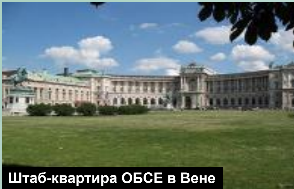
Штаб-квартира ОБСЕ в Вене