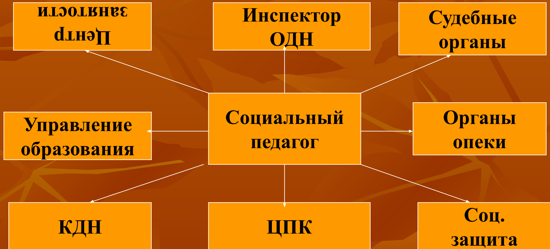
СХЕМА ВЗАИМОДЕЙСТВИЯ СОЦИАЛЬНОГО ПЕДАГОГА