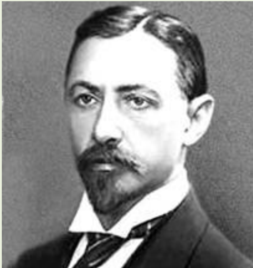
Бунин Иван Андреевич