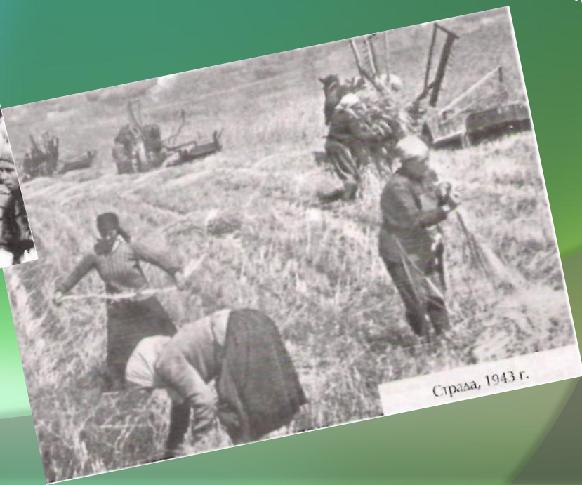
Страда, 1943 г.