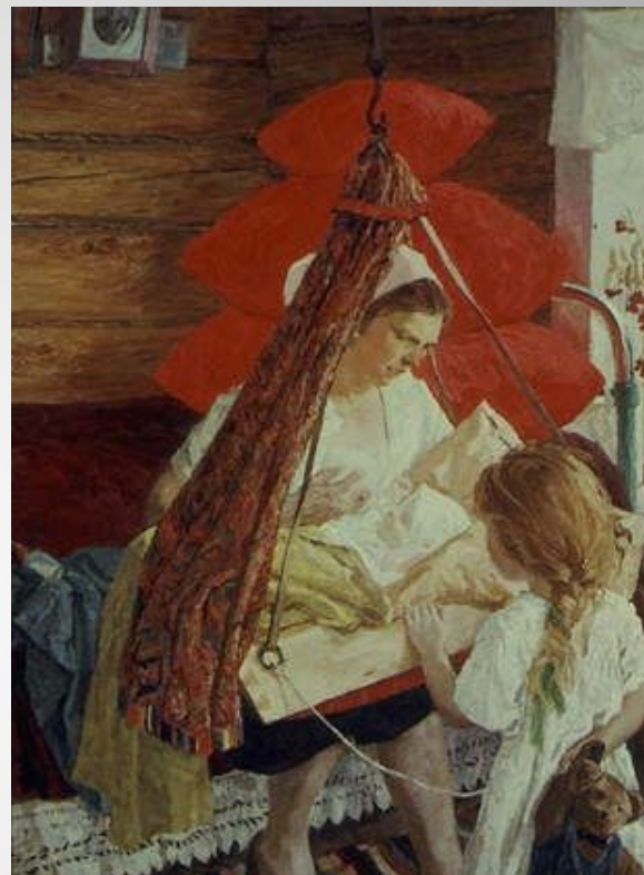
Пластов Аркадий Александрович: Мама