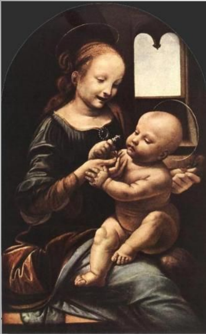
Леонардо да Винчи «Мадонна с Младенцем»