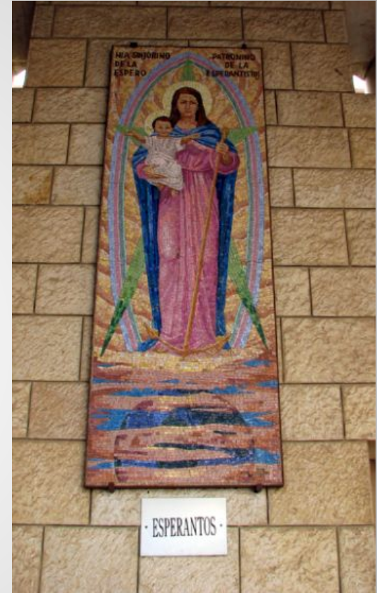
Назарет. Храм Благовещения