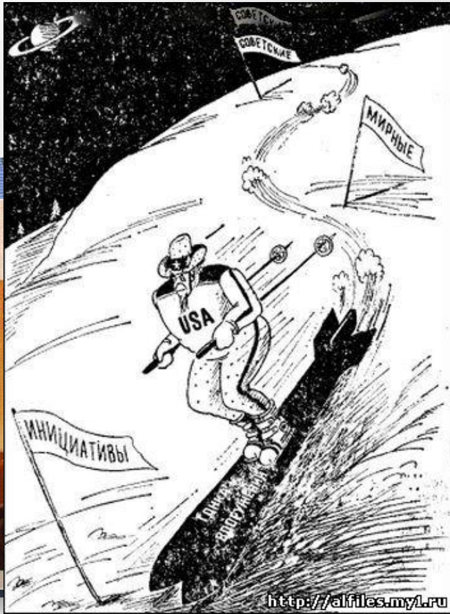
Карикатуры на США