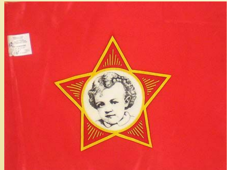
Флажок октябрятского отряда