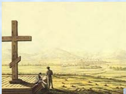
«Сопка близь Читы с могилы неизвестного солдата»