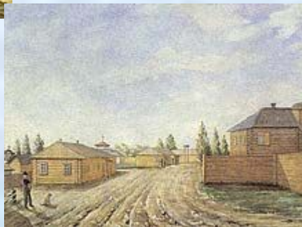
«Главная улица в Чите»