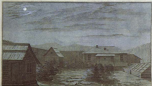
«Второй читинский острог в лунную ночь»