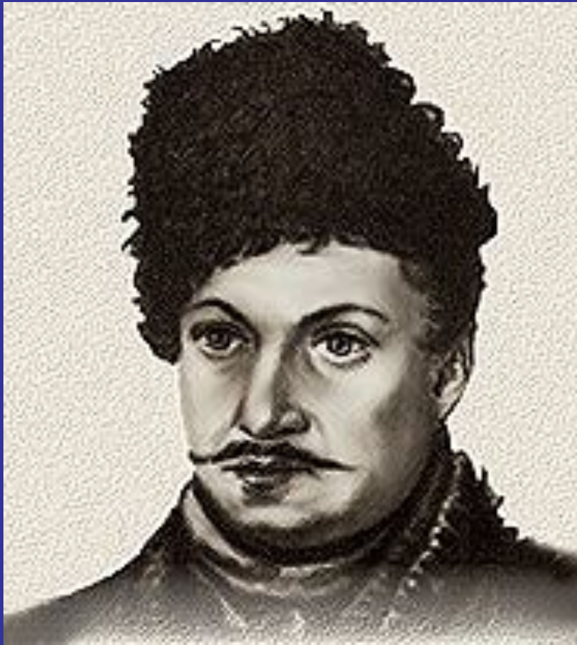
Рисунок Н.Бестужева 1839г.