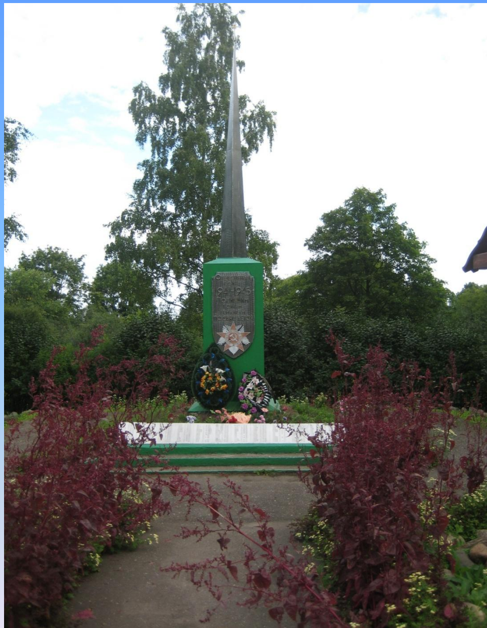
10. Обелиск воинам-землякам.